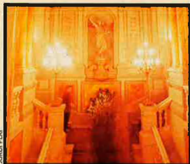
València veurà les òperes del Liceu gràcies a Internet.