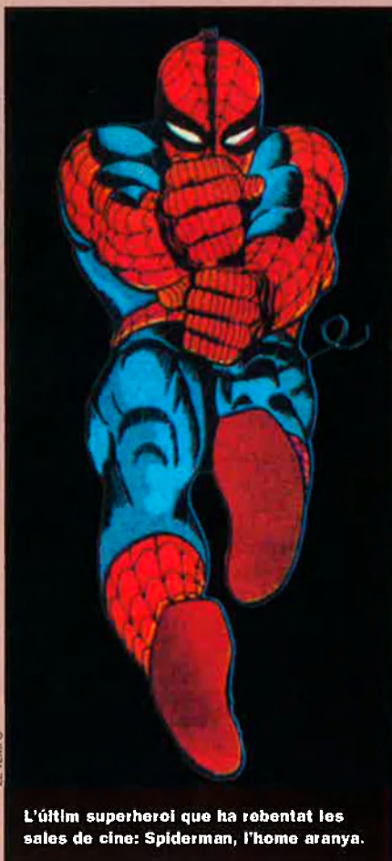
L' ltim superheroi que ha reobentat les sales de cine: Spiderman, l'home aranya.

Les noves tecnologies digitals, capaces de crear tot un m n d'imatges fins llavors inimaginables, i un nou tipus de p blic, molt m s jove i educat amb la