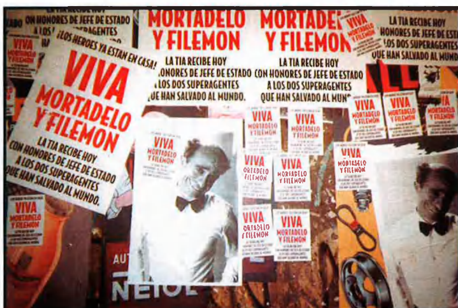
Per moments, el centre històric de València semblava un còmic gegant, viu. Els carrers es van omplir de molts signes que evidenciaven la presència dels mítics Mortadel·lo i Filemó.

Decorats de pur còmic. A causa del secretisme absolut i el menyspreu que l'encarregat de producció mostra cap al nostre treball, decidim deixar per