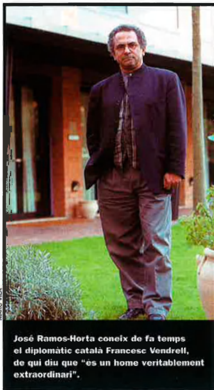
José Ramos-Horta coneix de fa temps el diplomàtic català Francesc Vendrell, de qui diu que "es un home veritablement extraordinari".

—Tenim una gran dificultat i un gran repte que és la manutenció de la nostra televisió nacional. Els països donants volen imposar condicions per ajudar la televisió, volen que el govern no hi tingui cap intervenció. Però nosaltres estem determinats a mantenir la nostra televisió nacional, no sota el control del govern però amb la participació del govern en termes financers i de tenir un representant. Perquè si és un instrument nacional d'informació i educació, si del govern s'espera que tingui un paper central en l'educació, per què no s'accepta que el govern tingui un paper en la televisió nacional? No es pot entregar la ràdio i la tele-