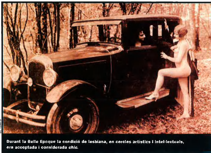
Durant la Belle Époque la condició de lesbiana, en cercles artístics i intel·lectuals, era acceptada i considerada chic .