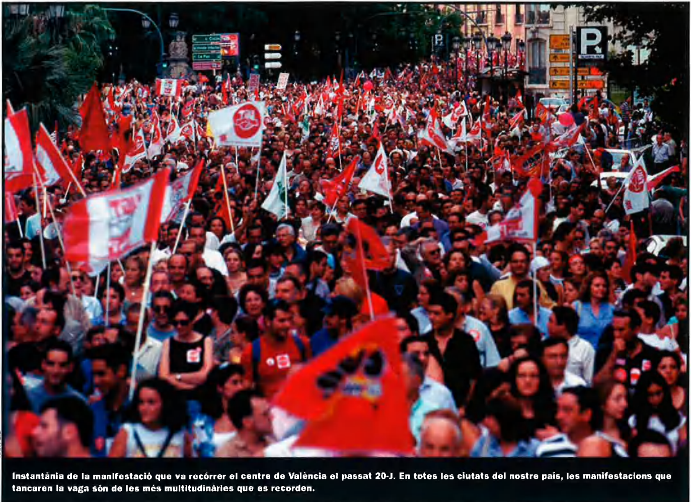
Instantània de la manifestació que va recórrer el centre de València el passat 20-J. En totes les ciutats del nostre país, les manifestacions que tancaren la vaga són de les més multitudinàries que es recorden.

És, doncs, difícil fer una valoració exacta de l'èxit de la vaga a Catalunya. Per tant, cal deixar de banda interpretacions maniquees provinents d'una o altra banda i fixar-se en aquelles dades que permeten una interpretació el màxim d'objectiva. En aquest sentit, sembla útil recórrer a xifres com la de consum elèctric. A Catalunya es va produir una davallada del consum elèctric del 26%. Una xifra que va situar la corba de consum elèctric del Principat en una línia molt semblant a la que es produeix en els dies festius.