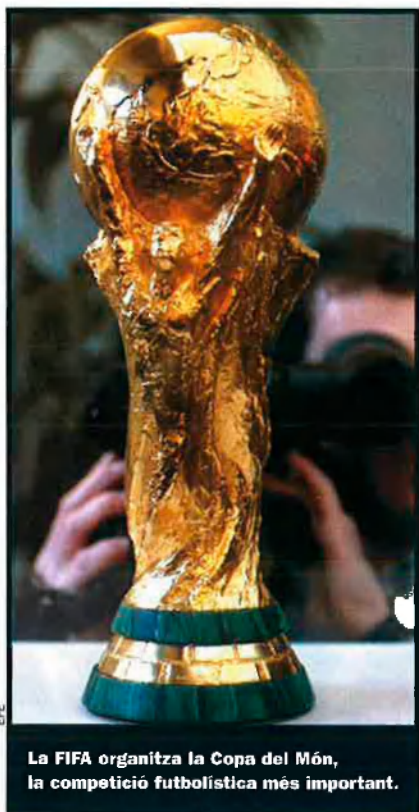
La FIFA organitza la Copa del Món, la competició futbolística més important.

ferents de les de David Will, el qual qüestiona les xifres presentades per l'executiu de Blatter a l'informe 1999/2001, així com les previsions pressupostàries 2003/2006. Així, per exemple, mentre que l'informe oficial assenyalava un benefici de 154 milions de francs per a l'any 2001, Will parla d'un dèficit de 572 milions.