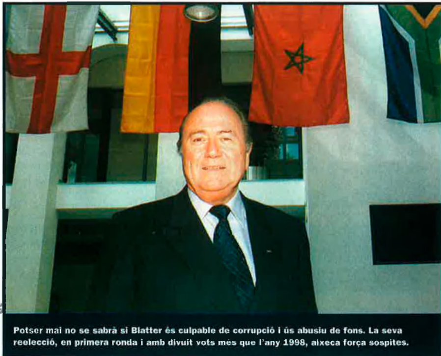
Potser mai no se sabrà si Blatter és culpable de corrupció i ús abusiu de fons. La seva reelecció, en primera ronda i amb divuit vots més que l'any 1998, aixeca força sospites.