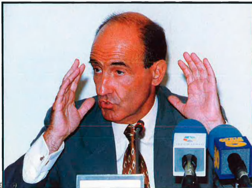
La Intenció del PP de jubillar Josep Vilarasau al capdavant de la Caixa a través de la llei financera que prepara ha disparat els rumors sobre els possibles substituïts. Hi ha qui apunta a Josep Piqué, actual ministre d'Afers Estrangers, o a Miquel Roca, actualment al capdavant d'un bufet d'advocats.