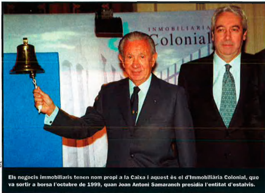
Els negocis immobiliaris tenen nom propi a la Caixa i aquest és el d'Immobiliària Colonial, que va sortir a borsa l'octubre de 1999, quan Joan Antoni Samaranch presidia l'entitat d'estalvis.

bles. El BBVA era el primer accionista de Repsol, de manera que el paper de la Caixa era de segon, el que li agradava. Però la crisi igualment arriba al banc basc i per partida doble: pèrdues considerables també a l'Argentina i crisi moral per culpa dels comptes secrets del banc i la imputació penal de 22 consellers. El BBVA ven accions de Repsol i ara la Caixa queda una vegada més en primer rengle. Alfonso Cortina es troba entre l'espasa —els homes de la Caixa a Repsol, que no dominen, però hi tenen pes— i la paret —els homes de la Caixa a Gas Natural, que tenen més pes que ells—. Quan aconseguix agafar el son, deu somniar amb el logotip de la Caixa, obra de Joan Miró.