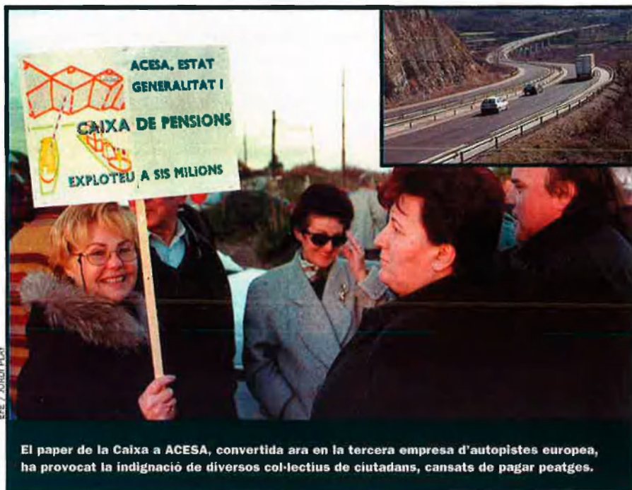
El paper de la Caixa a ACESA, convertida ara en la tercera empresa d'autopistes europea, ha provocat la indignació de diversos col·lectius de ciutadans, cansats de pagar peatges.

d'ACESA i li feia poca il·lusió tenir-lo. El govern socialista va pensar, fins i tot, d'incorporar ACESA a una empresa pública que creà per fer-se càrrec de les autopistes en fase terminal –l'Empresa Nacional de Autopistas, SA– i que la iniciativa privada no podia mantenir. Però en dos anys, ACESA experimentà un canvi espectacular, gràcies al canvi de conjuntura i al fort increment del trànsit. El negoci d'autopistes és d'aquells que exigeixen una inversió inicial enorme, que només és rendible al cap d'uns anys. Però quan dóna el tomb es converteix en un negoci boníssim. L'any 1987 les accions d'ACESA van cotitzar a la Borsa de Barcelona, amb un gran èxit de subscripció entre el petit estalvi: "Compri un tros d'Autopistes des de 2.830 pessetes", deia la publicitat.