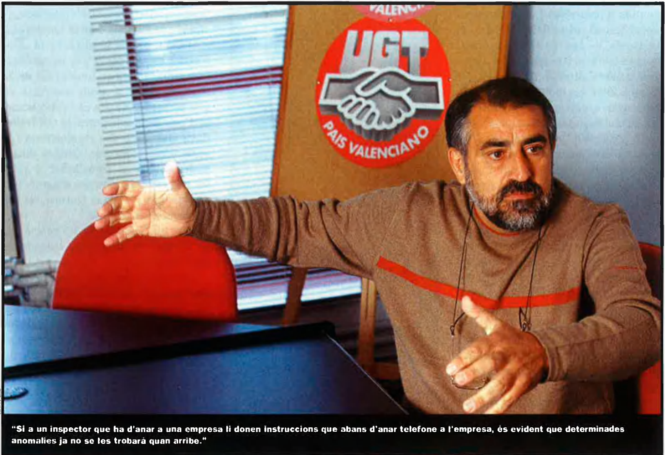
"Si a un inspector que ha d'anar a una empresa li donen instruccions que abans d'anar telefone a l'empresa, és evident que determinades anomalies ja no se les trobarà quan arribe."

que té més poder adquisitiu. A partir d'aquest fet, el moviment sindical ha de donar resposta quan creu que toca i quan pot. Ara, afortunadament, el conjunt de Comissions i d'UGT han pensat que és el moment.