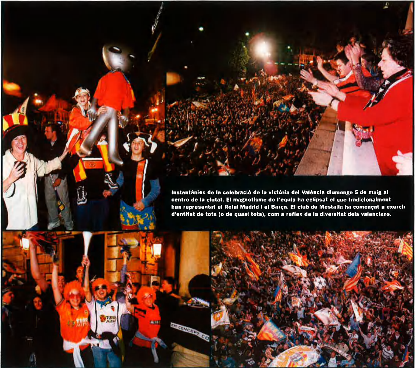
Instantànies de la celebració de la victòria del València diumenge 5 de maig al centre de la ciutat. El magnetisme de l'equip ha eclipsat el que tradicionalment han representat el Reial Madrid i el Barça. El club de Mestalla ha començat a exercir d'entitat de tots (o de quasi tots), com a reflex de la diversitat dels valencians.

És, per exemple, l'opinió de l'escriptor i periodista Enric Sòria, que al seu article de l'edició valenciana d' El País del passat 9 de maig palesava aquest sentiment. "Sentir estima per les coses dels paisans que la mereixen em sembla una actitud molt més sana i raonable que menysprear-les sense cap motiu. Es un component més del patriotisme ciutadà", escrivia.