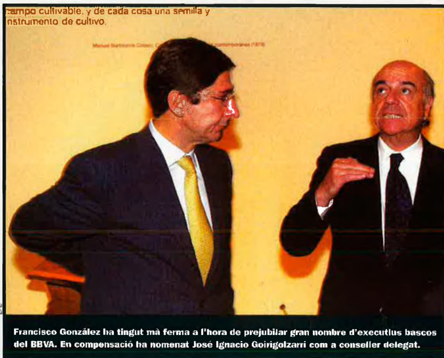
campo cultivable, y de cada cosa una semilla y instrumento de cultivo.