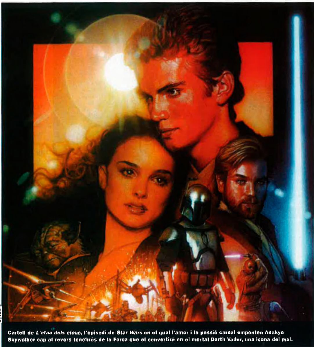
Cartell de L'atac dels clons , l'episodi de Star Wars en el qual l'amor i la passió carnal empenten Anakyn Skywalker cap al revers tenebrós de la Força que el convertirà en el mortal Darth Vader, una icona del mal.

Espectacle i dignitat. George Lucas és un productor i director estrany, que sembla devorat per la seua pròpia creació, per tot allò que volia evitar. Lucas pertany al clan de Martin Scorsese, Steven Spielberg, Francis Ford Coppola o Brian de Palma, la gent que en els anys 70 va barrejar com mai abans els conceptes de comercialitat i qualitat cinematogràfiques. Només en aquella època semblava possible que la pel·lícula més taquillera de la temporada fóra Apocalypse now i no Nunca me han besado , o bunyols per l'estil.