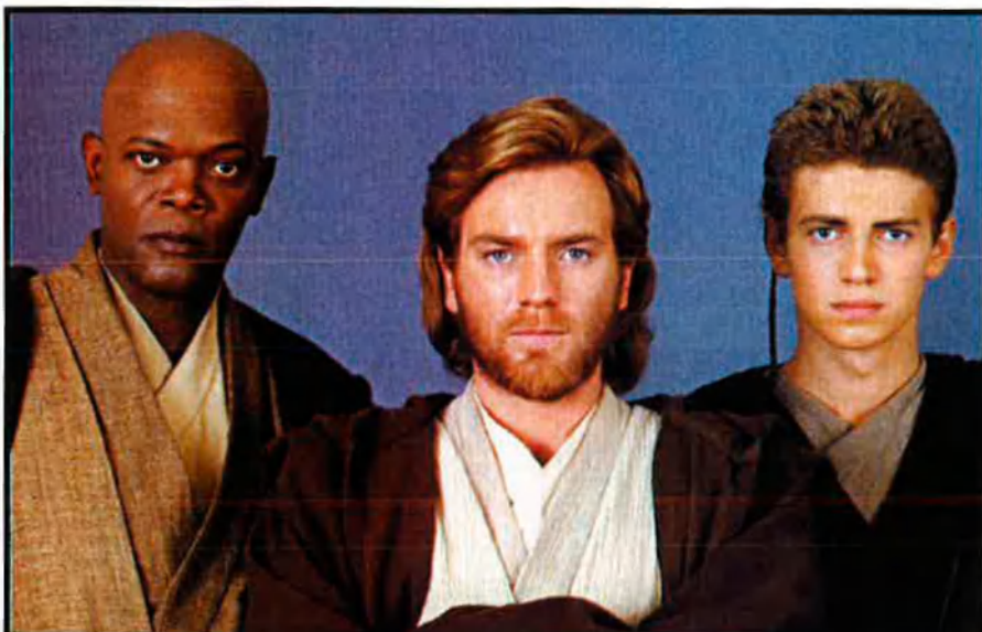
Dalt, d'esquerra a dreta, els actors Samuel L. Jackson, Ewan Mc Gregor i Hayden Christensen, els Jedi de L'atac dels clons . A sota, el seu enemic Jango Fett. Al costat, l'actriu Natalie Portman caracteritzada de Padmé Amidala.