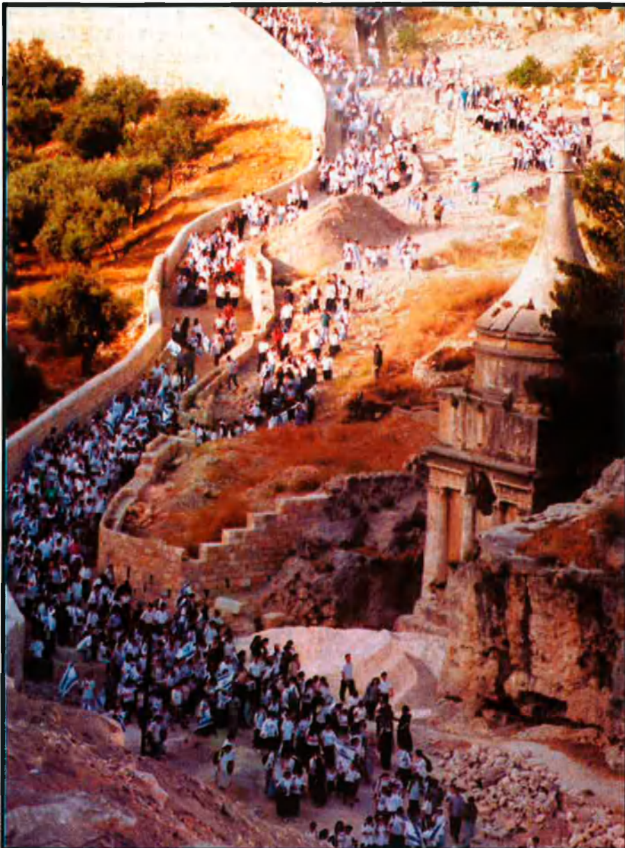
El 14 de maig, dia de la independència d'Israel (1948), milers de jueus travessen la vall de Cèdron, tot passant per davant del sepulcre d'Absalom i aturant-se a l'Hort de les Oliveres.

tradicions. Fins i tot hi ha pensadors que no el descriuen com una religió, sinó com una forma de vida.