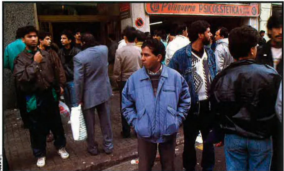
El conflicte arrela en el desequilibri entre l'oferta i la demanda. Hi ha molts més treballadors que ofertes de feina. Cal que es busqui una millor regulació.

Carnets de conduir. D'altra banda, el Departament d'Interior ha prohibit des de fa més d'un any als Mossos d'Esquadra que es multin els conductors del Marroc que no tinguin carnet de conduir espanyol. Interior va dictar aquesta prohibició al mes d'abril de l'any passat amb l'al·legació que s'havien iniciat converses entre els governs d'Espanya i el Marroc per convalidar els permisos de conduir. Posteriorment, la crisi diplomàtica entre els dos països va paralitzar les negociacions, però l'ordre de prohibició de multar els conductors del Marroc encara continua vigent, segons han denunciat els sindicats dels Mossos d'Esquadra (SEC i CAT), les quals asseguren que la raó de fons de la prohibició no són les negociacions per