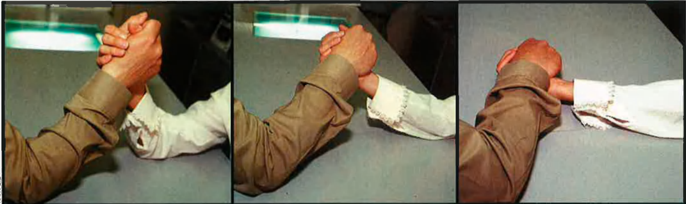
La sèrie d'imatges escenifica el pols en la batalla dels sexes entre homes i dones. L'emulació dels aspectes més criticables del comportament masculí ha estat entesa per algunes dones com un signe d'igualtat. El camí, però, hauria de basar-se en la pròpia evolució.

com ho varen ser les feministes dels 70, sinó que busquen fixar el seu paper d'igualtat en el si individual, en la lluita pròpia no col·lectiva. Les èpoques han canviat, i els objectius aconseguits hi són presents, però no tenen temps per pensar en la resta de les dones. Han acceptat que el poder econòmic, polític i executiu encara continua en mans dels homes, i pensen d'aconseguir el seu propi poder com a persones, no com a dones.