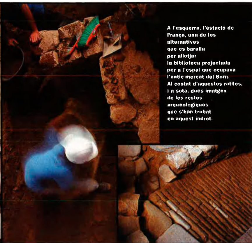
A l'esquerra, l'estació de França, una de les alternatives que es baralla per allotjar la biblioteca projectada per a l'espai que ocupava l'antic mercat del Born. Al costat d'aquestes ratlles, i a sota, dues imatges de les restes arqueològiques que s'han trobat en aquest indret.