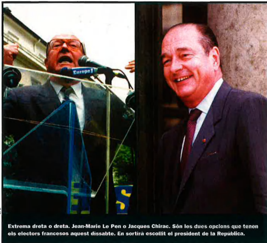
Extrema dreta o dreta. Jean-Marie Le Pen o Jacques Chirac. Són les dues opcions que tenen els electors francesos aquest dissabte. En sortirà escollit el president de la República.

Cal fundar una VI República? Tornar al parlamentarisme pur? Però si es confirma l'augment de Le Pen, com es pot evitar que el Front tingui en els propers anys un nombre d'escons no gaire inferior als socialistes, per exemple? El mapa electoral francès és eloqüent: hi ha tres països que s'ignoren i conviuen al mateix temps, cadascun amb un 30% dels vots, de dreta, d'esquerra i de gent