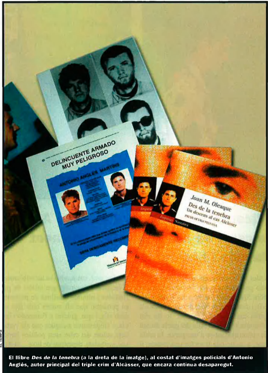
El llibre Des de la tenebra (a la dreta de la imatge), al costat d'imatges policials d'Antonio Anglés, autor principal del triple crim d'Alcàsser, que encara continua desaparegut.

A banda de conèixer Antonio, coneixia també al seu pare (que va morir fa temps), la seua mare i la majoria dels seus germans i amics. El meu propi pare també els coneixia a tots, i, per a l'elaboració del llibre, em va orientar molt. Ell va morir durant aquest procés de redacció. Va ser la major desgràcia d'un període de la meua vida molt ric en moments difícils. L'escriptura obsessiva d'una desgràcia tan gran com la d'Alcàsser era una mena de fugida torturada de les meues pròpies desgràcies personals.