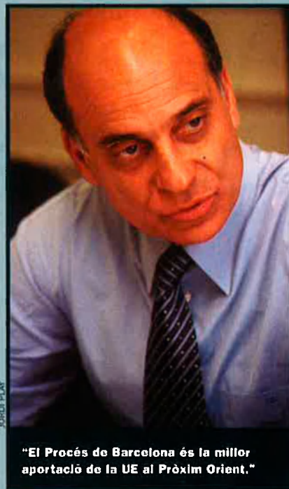
"El Procés de Barcelona és la millor aportació de la UE al Pròxim Orient."

— No. Però si es pogués tirar endavant tot l'Informe del Parlament