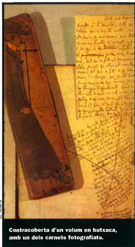
Contracoberta d'un volum en butxaca, amb un dels carnets fotografiats.

Els carnets també deixen constància de la seva intenció de reduir la seva vida social, per culpa de la mala salut, i tancar-se a casa, a escriure: “Potser em cal beneir la meua mala salut, que m’ha atrapat, per la lentitud, la fatiga, la immobilitat, el silenci, la possibilitat de treballar.” Com tot bon escriptor, sap detectar els bons autors –dels quals aprèn– dels dolents, que li ensenyen els mals camins que cal evitar. Li veu, per exemple, el llautó al mediocre Maurice Barrès, en una curta frase que és el resum de tot un programa literari: “Escriptor que se sacrifica a l’instint íntim esdevé pompier .” Els planians, que lògicament són lectors apassionats de Proust, descobriran en els carnets