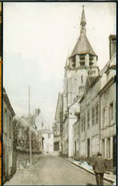
Marcel Proust cap al 1896. Els seus carnets, de format vertical, il·lustraven, amb els quaderns, els volums d' À la recherche du temps perdu publicats per Gallimard a la col·lecció "Le livre de poche", els anys 60-70. A la dreta, un carrer de l'església d'Illiers, el Combray de Proust.

esborrall. Ja des del primer full, pot escriure-hi frases, poc o molt llargues, descriptives o narratives, ben collades, segurament per trobar el nou estil, el nou to, la nova tècnica, que l'ajudi a trobar un camí nou. Entre els anys 1895 i 1899, Proust, massa jove, va intentar escriure una novel·la, Jean Santeuil –rescatada el 1952– però, lúcida com era, només va poder constatar-ne el fracàs i la va desar al calaix.