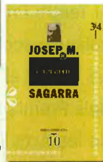
Josep M. Sagarra OBRA COMPLETA, VOL 10