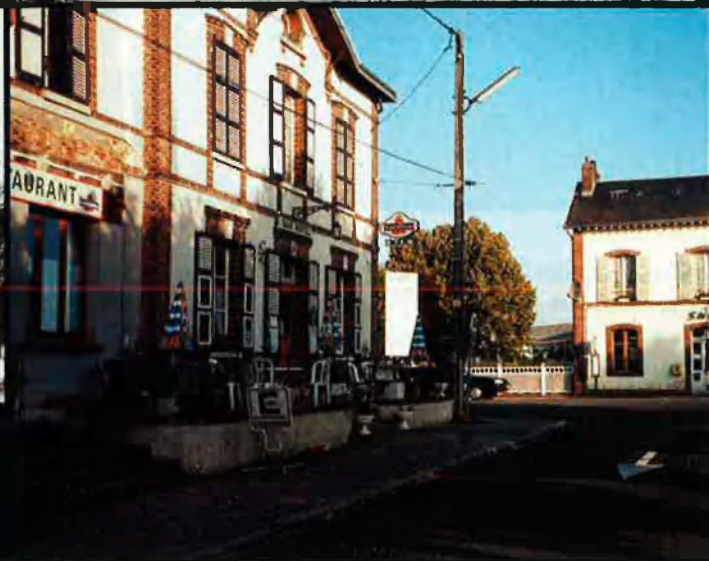
A dalt, el Gran Hotel de Cabourg, on Proust prenia notes, durant els estius, als seus carnets. L'estació de tren d'Illiers, avui Illiers-Combray en homenatge a Proust, en una foto d'època i a l'actualitat. En un dels seus carnets, Proust reflexiona sobre el record que té de l'estació.

parlar o l'efecte que produeix un determinat adjectiu al costat d'un determinant substantiu, llegit, escoltat o combinat per ell. O bé aparents expressions populars com "riure com un geperut" que, descobreixen els anotadors dels volums, posarà en boca d'un personatge. La seva preocupació per la "sinceritat" expressiva el porta a comentar que la manera de dir a una persona que ens agrada veure-la, pot ser o bé sincera o bé trista, segons l'ordre sintàctic de la frase.