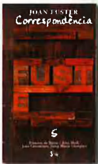
Joan Fuster CORRESPONDÈNCIA, 5