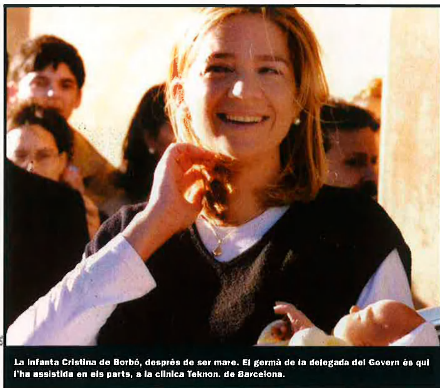
La infanta Cristina de Borbó, després de ser mare. El germà de la delegada del Govern és qui l'ha assistida en els parts, a la clínica Yeknon, de Barcelona.