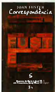
Joan Fuster CORRESPONDÈNCIA, 5