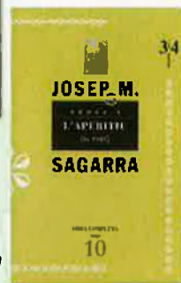
Josep M. Sagarra OBRA COMPLETA, VOL. 10