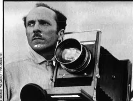
EDWARD WESTON / TINA MODOTTI