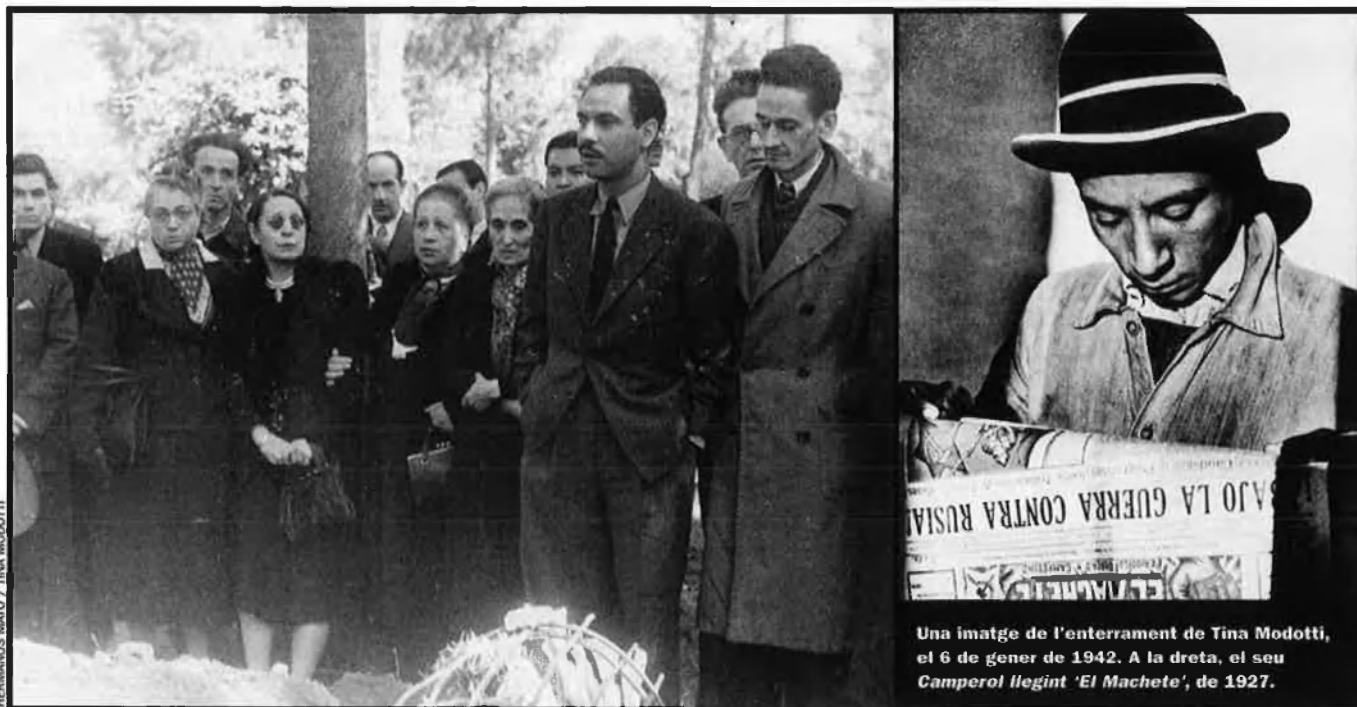
HERNANDES MAYO / TINA MODOTTI