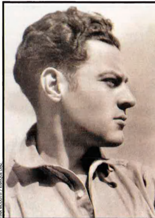
Julio Antonio Mella, vist per Tina Modotti. Al costat, Tina en un miting pel seu assassinat, i l'enterrament.