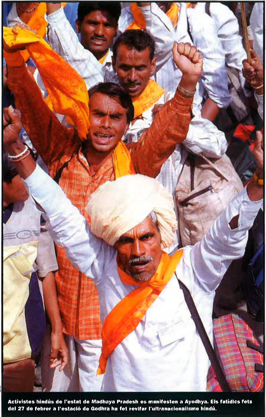
Activistes hindús de l'estat de Madhya Pradesh es manifesten a Ayodhya. Els fatídics fets del 27 de febrer a l'estació de Godhra ha fet revifar l'ultranacionalisme hindú.

Els altres grups polítics indis titllen aquest grup de feixista, especialment per les posada en escena de les seves bases: vestits amb barret negre, pantalons curts de color caqui, un bastó d'un metre i mig i molta disciplina militar. Entre les seves bases promouen les arts marçials i els preceptes militars sanscrits, i els manen escampar el seu missatge per tots els sectors de la societat. Un dels sectors de població on han buscat aliats a la seva causa és entre els militars retirats, i crearen, el 1993, la Unió per la Defensa dels Drets dels Antics Soldats (PSSP): Reclamaven millores salarials i una política bel·licista per a "desgreujar" el país de l'etern enemic pakistanès. També tenen una àmplia xarxa d'escoles, de par-