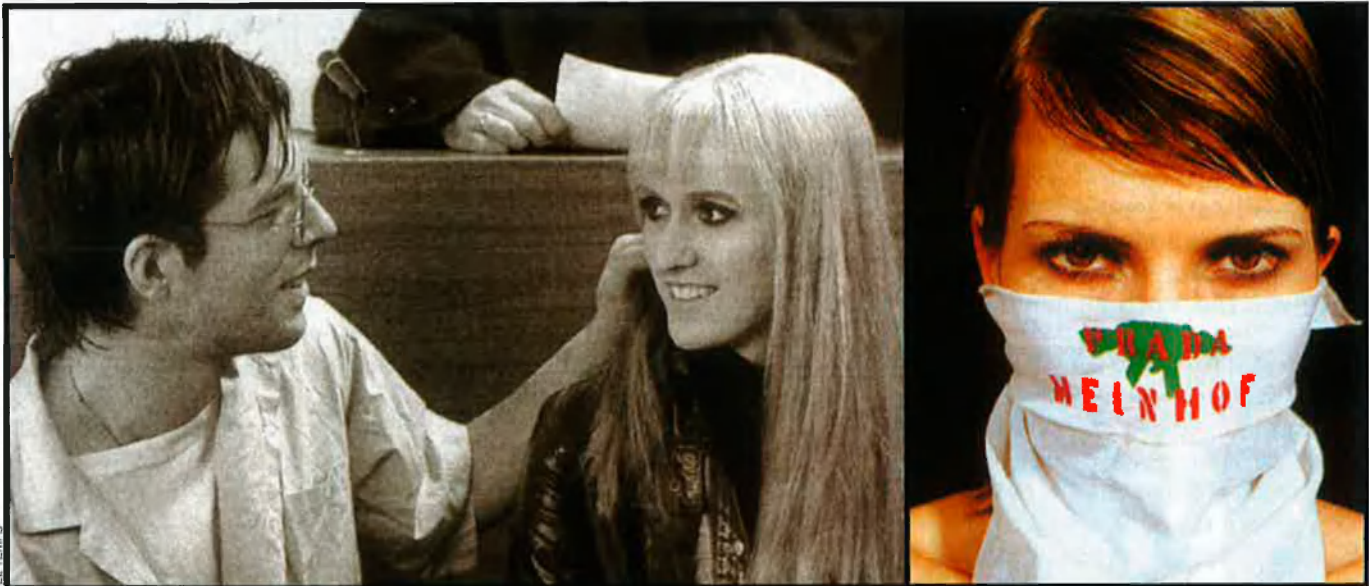
El mite de la lluita dels "sis contra els seixanta milions" és viu. I això s'ha pogut comprovar darrerament en una munió de propostes: des de les audiovisuals –amb la pel·lícula, Baader – al paper acolorit de les publicacions de moda més in.