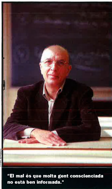
"El mal és que molta gent conscienciada no està ben informada."

—Encara hi ha un altre error que crec que la gent té: que les organitzacions internacionals són instruments que estan en les mans de les multinacionals. És a dir, com si les multinacionals fossin les que redactessin els acords i el contingut del que passa internacionalment. Això és fals. Aquestes organitzacions internacionals són burocràcies més o menys incon-