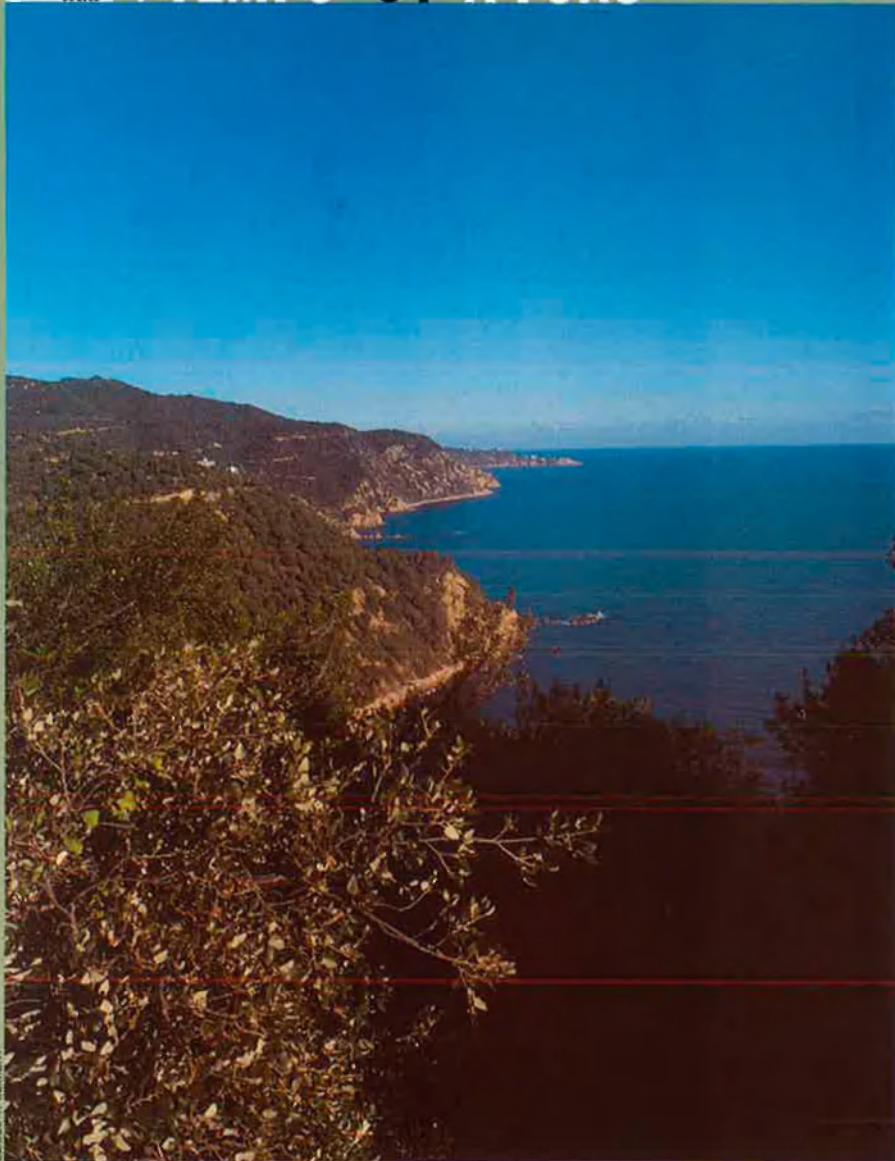
ELISEU T. CLIMENT

A partir de les dues centes milles, les aigües no pertanyen a ningú. Més enllà ja hi ha les anomenades aigües internacionals.