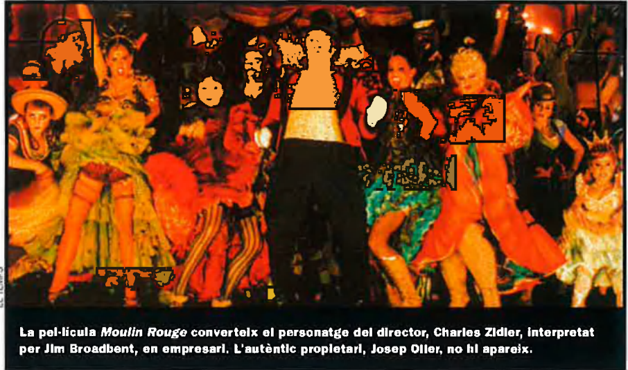
La pel·lícula Moulin Rouge converteix el personatge del director, Charles Zidler, interpretat per Jim Broadbent, en empresari. L'autèntic propietari, Josep Oller, no hi apareix.

La gran biografia de Canyameres. L'apassionant vida de l'empresari modèlic i envejat va merèixer l'interès d'un altre terrassenc, l'escriptor Ferran Canyameres. L'any 1946, Canyameres publica a París L'homme de la belle époque , i tretze anys després n'escriu la versió catalana, molt ampliada, Josep Oller i la seva època. L'home del Moulin Rouge (Barcelona, editorial Aedos).