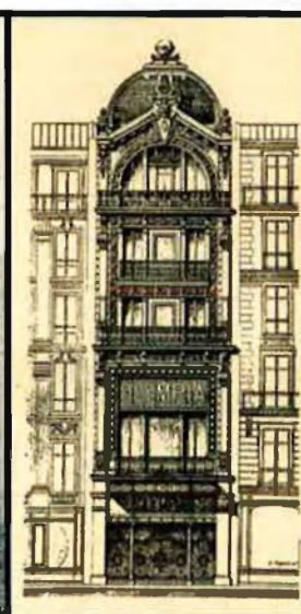
El primer carro d'apostes de carreres de cavalls d'Oller, previ a l'obertura d'oficines. Al costat, dibuix de la façana original de l'Olympia, fundat per Oller el 12 d'abril del 1893. Va ser la darrera gran creació de l'empresari. Superava en gust i bellesa el que s'havia vist a París.