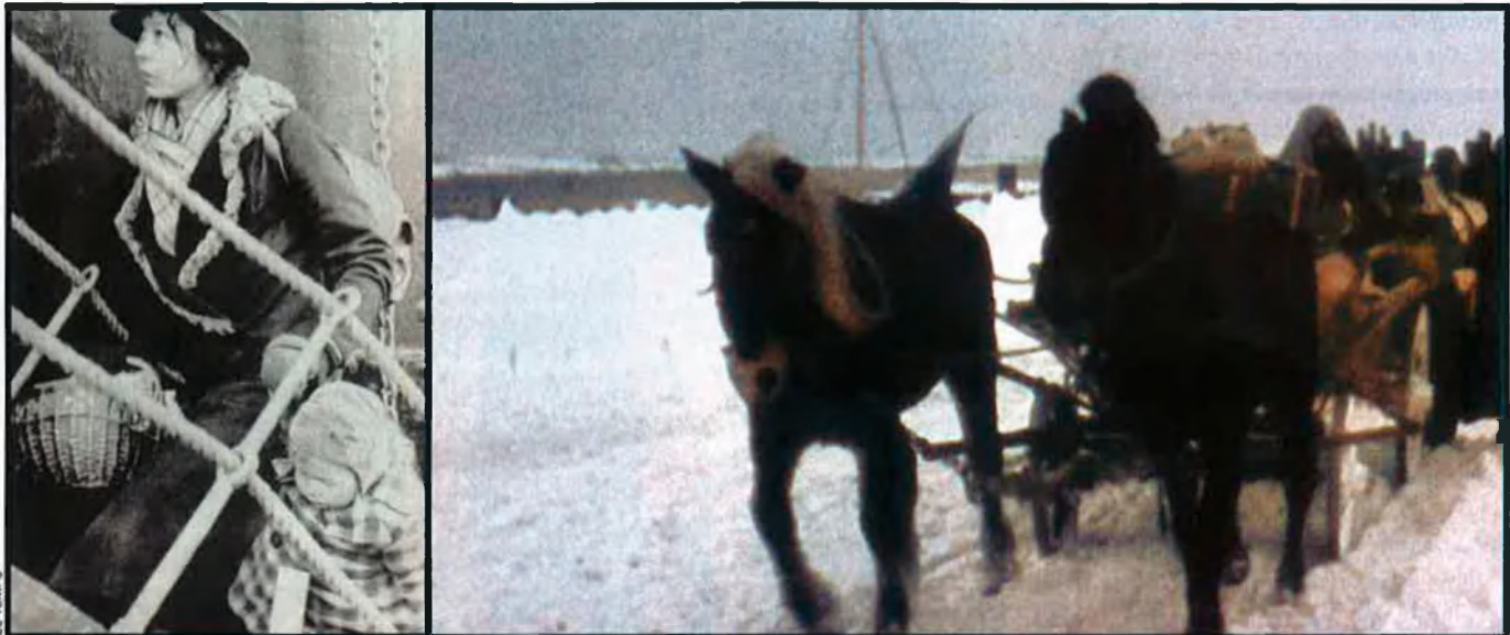
A l'esquerra, un moment de l'evacuació a Gothenhafen, l'any 1945. A la dreta, caravanes a la mar Bàltica als voltants de Heiligenbell (a principis del 1945), durant la tràgica fugida dels alemanys de les regions de l'est envers l'oest.

L'enfonsament del vaixell aquella glaçada nit de gener de 1945 tan sols va ser una, per bé que la més gran, de les catàstrofes que van ocórrer durant les evacuacions per mar de més de dos milions d'alemanys que fugien de l'avanç de l'Exèrcit Roig. El nombre de morts i ofegats arran de l'enfonsament del Gustloff es va estimar entre 5.000 i 6.000, però, ara per ara, es considera que hi hagué més o menys 9.000 morts, entre ells més de 4.000 xiquets i joves.