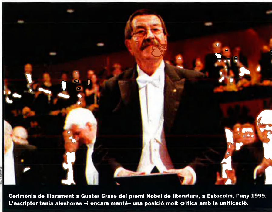
Cerimònia de lliurament a Günter Grass del premi Nobel de literatura, a Estocolm, l'any 1999. L'escriptor tenia aleshores —i encara manté— una posició molt crítica amb la unificació.

També la televisió se'n fa càrrec, com ara fa poc la sèrie de Guido Knopps a la ZDF (el segon canal de la televisió alemanya) sobre "La gran fugida". Els arxius s'obren, el material gràfic fins ara desconegut ix a la llum, els testimonis de l'època són interrogats —primer i abans de res la qüestió és què s'havia