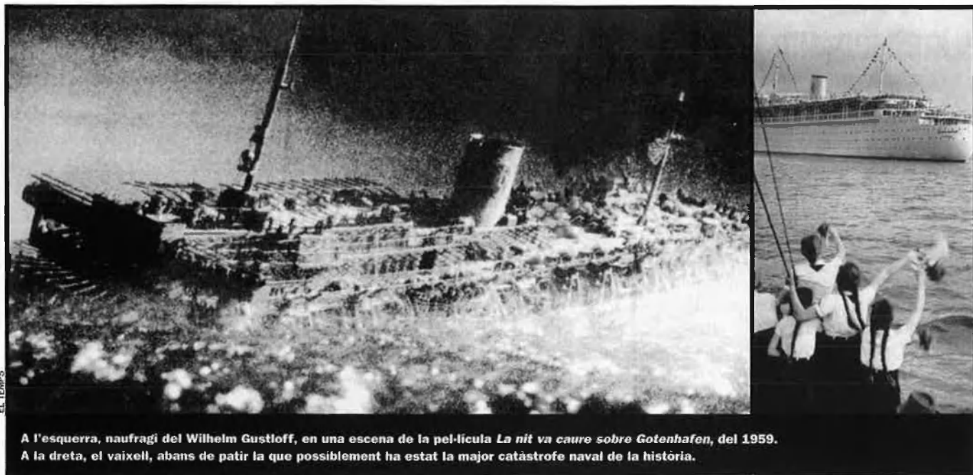
A l'esquerra, naufragi del Wilhelm Gustloff, en una escena de la pel·lícula La nit va caure sobre Gotenhafen , del 1959. A la dreta, el vaixell, abans de patir la que possiblement ha estat la major catàstrofe naval de la història.

Feia ja molt de temps que Grass no resultava tan convincent en una obra en prosa. Després de publicar la novel·la curta ( El gat i la rata ), tan sols li ha reeixit de veritat el joc narratiu en una obra secundària: Encuentro en Telgte ( Das Treffen in Telgte ) de 1979. Sobre tot les obres més importants, en el fons ja els Anys difícils , però especialment les novel·les Orlich betäubt (1969), La ratesa i Una llarga història ( Ein weites Feld ) (1995), així com –i no en darrer lloc– la col·lecció de textos en prosa El meu segle ( Mein Jahrhundert ) de 1999, delataven un diligent narrador que sovint, però, surt de mare i amb prou feines pot refrenar el seu temperament procliu a la política quotidiana i en què es troba a faltar l'energia habitual dels seus principis.