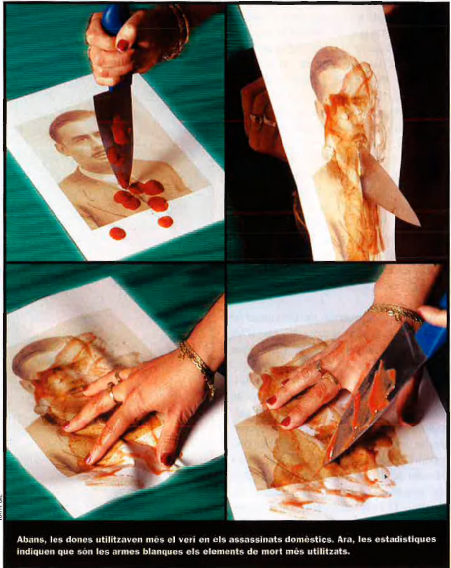
Abans, les dones utilitzaven més el verí en els assassinats domèstics. Ara, les estadístiques indiquen que són les armes blanques els elements de mort més utilitzats.

Però el 1997, la televisió, de manera terrible i accidental, va jugar a favor de