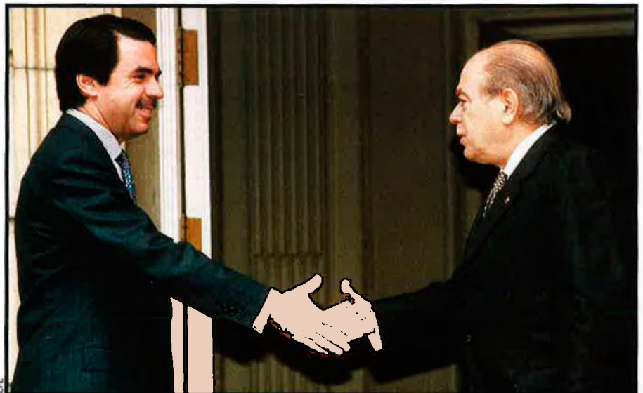
Jordi Pujol amb José Maria Aznar. Pujol explicarà, en una propera reunió amb el president espanyol, les propostes de l'executiu català per a la millora de l'autogovern.