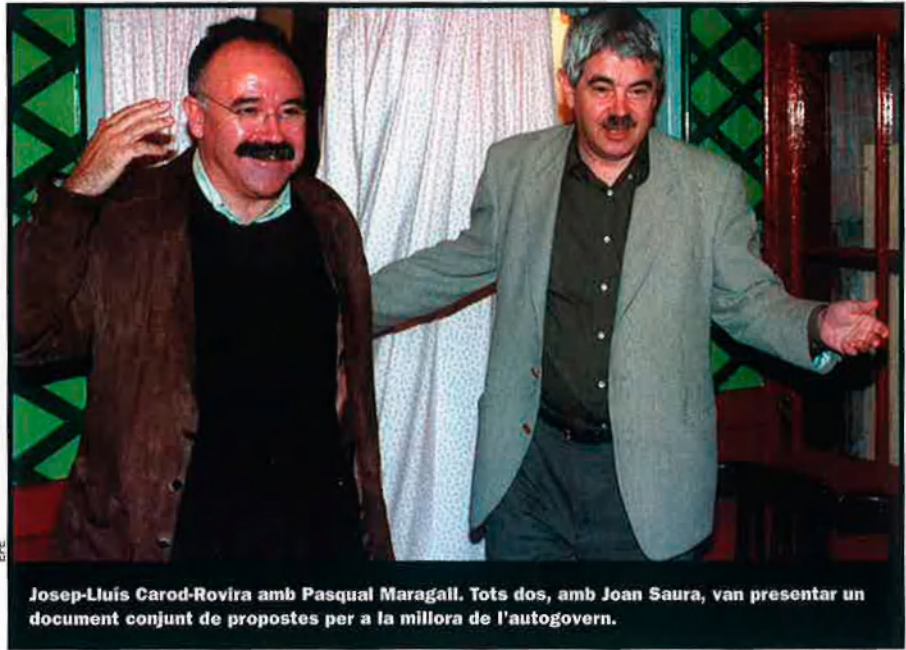
Josep-Lluís Carod-Rovira amb Pasqual Maragall. Tots dos, amb Joan Saura, van presentar un document conjunt de propostes per a la millora de l'autogovern.

El document subscrit entre els tres partits de l'esquerra parlamentària catalana han servit al PSC per visualitzar públicament una possible alternativa política. A ERC, l'acord, l'hi ha permès també aparèixer com a partit amb capacitat de diàleg i també per posar a prova la independència del PSC i el federalisme del PSOE. De moment, però, la setmana passada, els diputats del PSC-PSOE a Madrid s'abstienien en una proposta de CiU que demanava la presència directa de les comunitats autònomes a la UE. Aquest fet, més la crisi viscuda a l'Entesa del Senat (integrada per PSC, ERC i ICV), pel suport a Josep Borrell com a representant