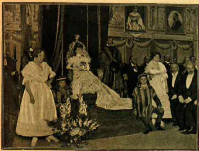
ELS JOCS FLORALS DE «LO RAT PENAT» DE LA CIUTAT DE VALÈNCIA. (A L'ESQUERRA DE LA REINA S'HI VEU EL GRAN POETA VALENCIÀ TEODOR LLORENTE)

molt petit, i a penes si en la memòria guardo alguns detalls d'aquell temps; però, regirant l'arxiu de mon benvolgut pare, toparem les meves mans amb unes cartes de Mossèn Cinto, referents al seu nomenament de Mantenedor i a sa estada en la meua València. Com resistir a la temptació de donar-les a la publicitat, essent preadíssimes joies de les nostres