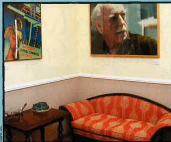
Imatge de Josep Renau i d'un dels seus fotomuntatges al "Cabanyal, portes obertes" del 2000. Part de la seua obra va ser exposada a les cases que l'Ajuntament vol enderrocar per prolongar Blasco Ibáñez.