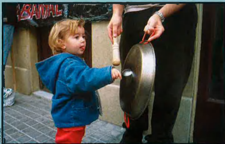
Instantània d'una de les múltiples perolades convocades pels veïns del Cabanyal a les portes de l'Ajuntament de València. L'oposició als plans de l'Ajuntament ha estat expressada amb múltiples fórmules.

Bohigas, que l'octubre del 2001 dirigia les jornades "Una mirada sobre el Cabanyal", organitzades per la Universitat Politècnica de València, creu que