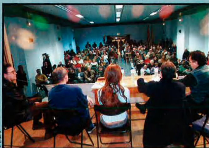
Imatge de l'última assemblea de Salvem el Cabanyal, el passat dimecres, dia 6 de febrer. Els veïns d'aquest barri van decidir de continuar amb la lluita perquè l'Ajuntament rehabiliti el Cabanyal.