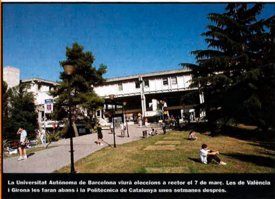
La Universitat Autònoma de Barcelona viurà eleccions a rector el 7 de març. Les de València i Girona les faran abans i la Politècnica de Catalunya unes setmanes després.

que siguin molt més greus: Si el Govern de l'estat no actua amb les mateixes presses que ara ha exigit a les universitats i no defineix i engega ràpidament l'anomenat sistema d'habilitació de professors, podria passar que hi hagués centres que no poguessin convocar places fins el 2004.