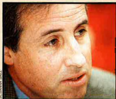
Valentí Roqueta és el president de Caixa Manresa.

Les entitats financeres han començat a passar comptes del 2001. Entre aquestes, Caixa Catalunya, que ha incrementat un 23,6% els seus beneficis nets respecte al 2000. Caixa Manlleu, per la seva banda, es consolida com la tercera caixa catalana en fons d'inversió gestionats, amb un increment del 32,9% d'aquests recursos i amb un augment més moderat, del 9,3%, dels seus beneficis nets. CAM i Bancaixa també creixen en beneficis: un 8,40% i un 12,77%, respectivament. Segons Adolf Todó, director general de Caixa Manresa, en els pròxims anys les entitats financeres continuaran immerses en una forta competència per la captació d'estalvi tradicional –per evitar problemes de liquiditat– i en la gestió de fons d'inversió.