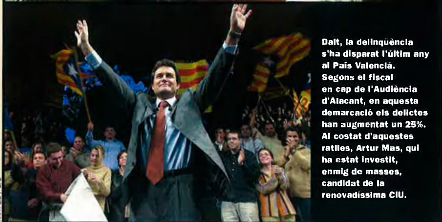
Dalt, la delinqüència s'ha disparat l'últim any al País Valencià. Segons el fiscal en cap de l'Audiència d'Alacant, en aquesta demarcació els delictes han augmentat un 25%. Al costat d'aquestes ratlles, Artur Mas, qui ha estat investit, enmig de masses, candidat de la renovadíssima CIU.

llorca, el dimarts 21, té la primera conseqüència interna en el Pacte de Progrés: la coalició EU-Els Verds anuncien que a partir d'aquell moment es consideren deslligats del Pacte global i que negociaran, com fa UM, exclusivament amb el PSIB. El motiu de la reorientació de l'actitud de la coalició és haver constatat que el pacte territorial ha estat negociat entre PSIB i UM, i així, els ha deixat a banda i sense permetre'ls més marge que acceptar-ho tot, o trencar completament. Per evitar el trencament i sortida del Govern, han optat per aquesta solució.