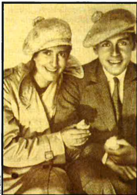
Erika i Klaus Mann, dos dels set fills de Thomas Mann, van tenir una importància rellevant en l'exili de la família, a l'endemà de l'accés de Hitler al poder.

Després vingueren altres temps més desconcertants: en l'Amèrica del Nord de la postguerra la família Mann va caure en el foc creuat del nou anticomunisme, només tangencialment, és cert,