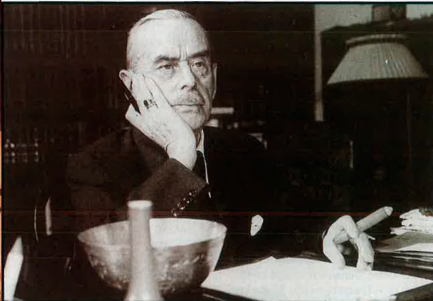
Thomas Mann va néixer a Lübeck el 1875, al si d'una rica família de comerciants. És d'aquesta tradició benestant de la família Mann que s'abeuren les seues novel·les.

però va ser prou desagradable, per exemple, quan van anar agents de l'FBI a la casa i van preguntar a Erika si era una "agent pagada per Stalin".