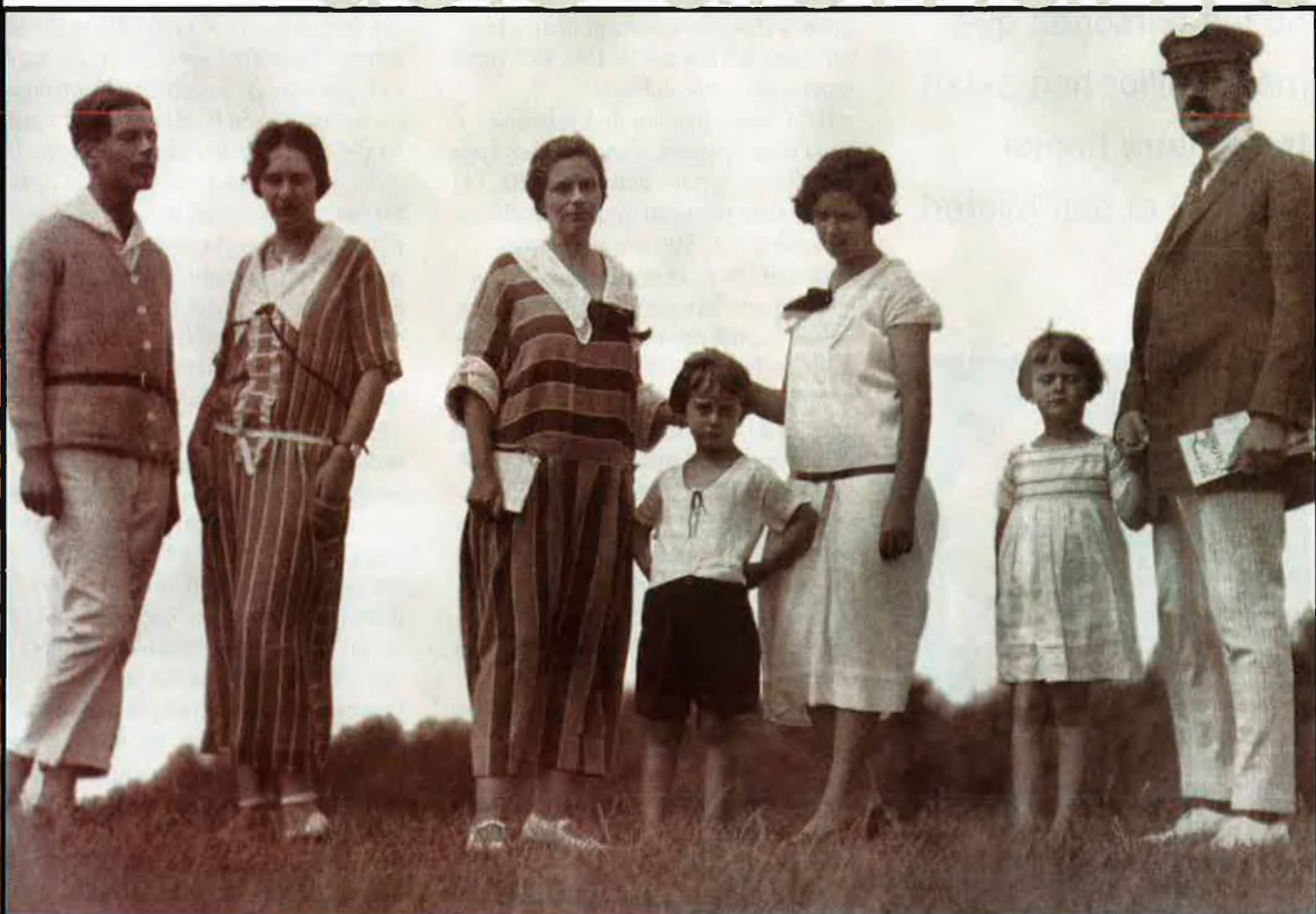
La família Mann l'any 1924 al poble De Hiddensee, situat en una illa de l'arxipèlag de Rügen, a la mar Bàltica. A partir d'aquest moment va començar la consagració de la família Mann com un dels referents literaris de tot Alemanya.