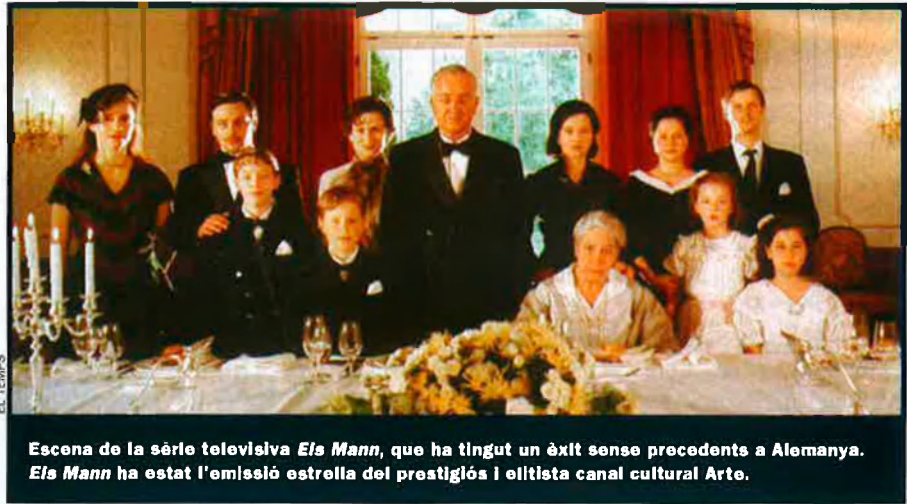
Escena de la sèrie televisiva Els Mann , que ha tingut un èxit sense precedents a Alemanya. Els Mann ha estat l'emissió estrella del prestigiós i elitista canal cultural Arte.

Klaus Mann es preguntava a començaments dels anys trenta si els fills no serien “els últims i malcriats descendents d’una elit burgesa i intel·lectual”. Trobava la seua infantesa, per bé que “de cara a l’exterior amb molta protecció”, “més qüestionable, més plena de perills”, que la “infantesa burgesa” a l’ús.