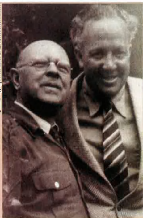
Josep Trueta va dedicar el seu The Spirit of Catalonia a Pau Casals (amb qui surt a la fotografia). El mapa és un dels que il·lustren el llibre, que fou traduït al català per Vicenç Riera Llorca i editat, des de Mèxic, l'any 1950.