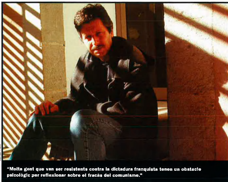
"Molta gent que van ser resistents contra la dictadura franquista tenen un obstacle psicològic per reflexionar sobre el fracàs del comunisme."

pols. D'altra banda, no hi ha suficient reflexió sobre el passat. Després de la caiguda sí, van sortir articles d'opinió. Ara, ja no tant. A nivell d'estudis històrics no hi ha una actitud objectiva respecte el passat, s'utilitza com a arma de propaganda política entre els partits.