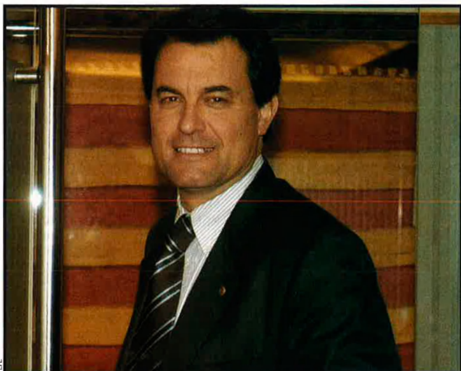
Artur Mas surt de la reunió de l'executiva de CiU que el va proclamar presidenciable. El conseller en cap vol que el president Pujol esgoti la legislatura fins a la tardor del 2003.

La setmana passada, l'executiva de CiU nomenà Artur Mas candidat oficial a la presidència de la Generalitat de Catalunya per a les pròximes eleccions al Parlament català. El proper 20 de gener, serà presentat davant la militància de la federació. Jordi Pujol culmina una operació per preparar el seu relleu que començava, ara fa uns mesos, amb la conversió de CiU en una federació.