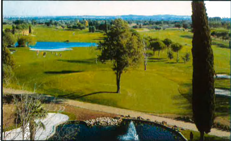
El camp de golf de Bonmont, en la imatge de dalt, combina mar i muntanya a la comarca del Baix Camp. El camp de golf d'Aigüesverds ofereix una situació immillorable al costat de la ciutat de Reus, i també molt a prop de Cambrils i Salou.

ves oliveres i ametllers, també es troben les poblacions costaneres de Salou i Cambrils per sentir el mar de ben a prop. Aigüesverds és un dels camps més grans de Catalunya, amb els seus greens tous i molt ràpids i, entre aquests, obstacles d'aigua col·locats estratègicament. Precisament un dels seus forats emblemàtics és el 3, amb una illa-green completament envoltada d'aigua. Entre els serveis que ofereix destaquen el de guarderia, l'escola de golf, l'hotel amb salons privats per a convencions i la piscina.