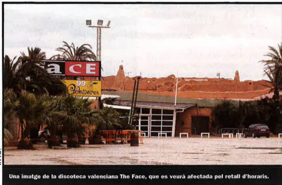
Una imatge de la discoteca valenciana The Face, que es veurà afectada pel retall d'horaris.