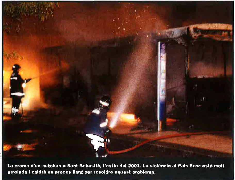
La crema d'un autobús a Sant Sebastià, l'estiu del 2001. La violència al País Basc està molt arrelada i caldrà un procés llarg per resoldre aquest problema.

El nefast protagonisme de Redondo. Durant un temps, mentre el PSE-PSOE va governar amb el PNB, va fer, en certa mesura, de pont entre