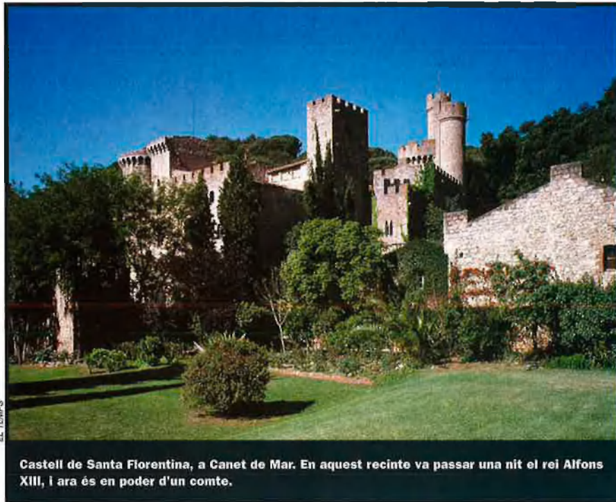
Castell de Santa Florentina, a Canet de Mar. En aquest recinte va passar una nit el rei Alfons XIII, i ara és en poder d'un comte.

En una visita a Arenys de Mar (Barcelona) l'any 1909, el rei es va entestar a dormir a la finca d'un americano , un mirador magnífic situat al punt més alt de la vila. A canvi del servei, el monarca li va oferir un títol nobiliari que l' americano va refusar, perquè creia que la casa no reunia les condicions per rebre un ciutadà tan distingit. Finalment, el sobirà va passar la nit al castell de Florentina, a Canet de Mar, que des de llavors ocupa un comte.