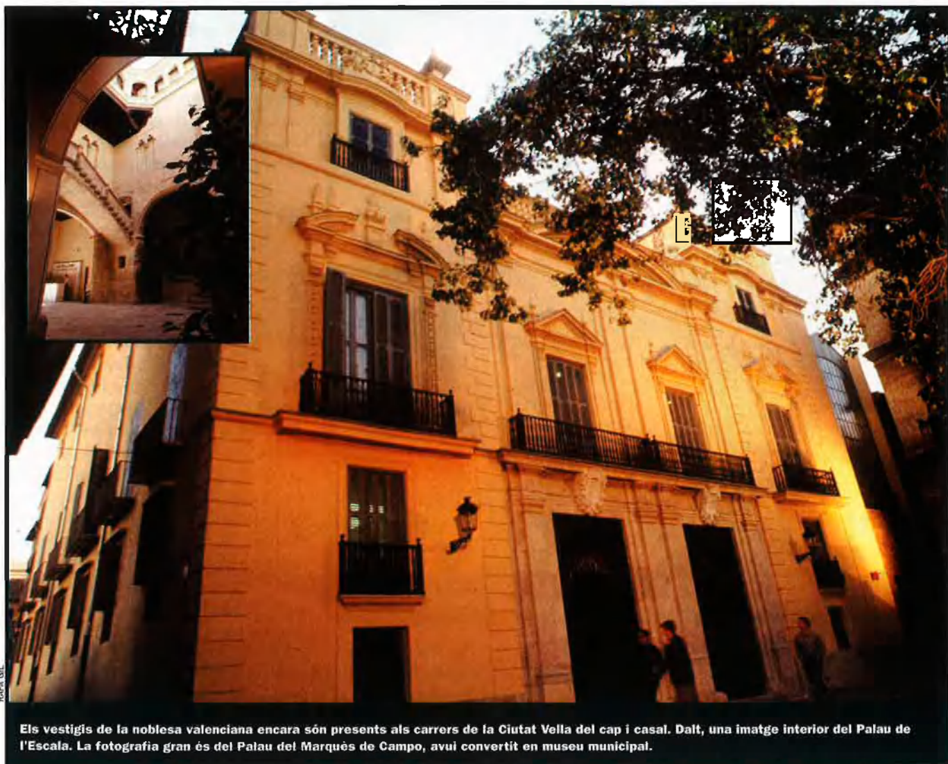
Els vestigis de la noblesa valenciana encara són presents als carrers de la Ciutat Vella del cap i casal. Dalt, una imatge interior del Palau de l'Escala. La fotografia gran és del Palau del Marquès de Campo, avui convertit en museu municipal.

A diferència del País Valencià, a les Illes no es van establir famílies de la vella noblesa catalana ni aragonesa. L'aristocràcia mallorquina ha estat molt condicionada per la insularitat. El mar la separava molt de la Corona d'Aragó i d'aquí que els títols estiguin en mans de poques famílies. Hi ha, però, un gran quantitat de noblesa no titulada. El gruix de títols foren otorgats els segles XVIII i XIX. Durant el segle XX no se'n van concedir.