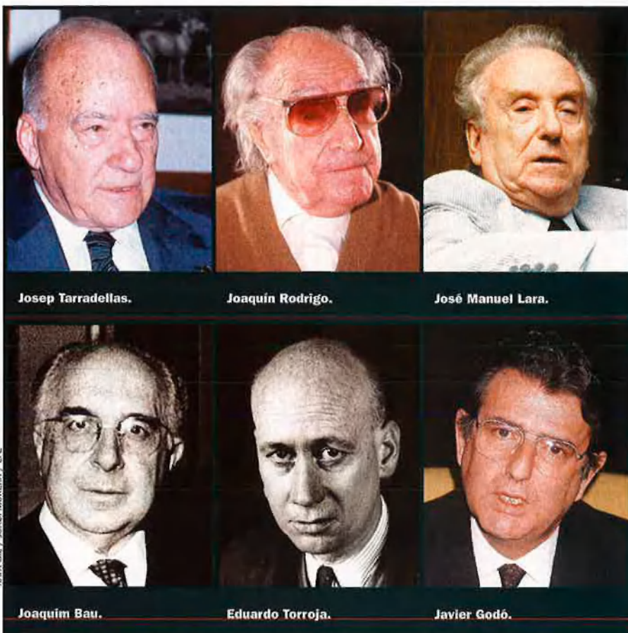
PÀG. 611

marquès de Kindelán, a més del reconeixement a personalitats decisives, com el duc de Calvo-Sotelo, per haver estat "Protomàrtir de la Cruzada". Al comte de Barcelona, Franco només li va permetre exercitar-se com a rei per atorgar el ducat de Badajoz a la seva filla, la infanta Pilar. Els únics catalans que van rebre un títol de mans de Franco són part de la meritocràcia científica i empresarial de l'època: l'oftalmòleg Hermenegild Arruga (comte d'Arruga), l'enginyer Eduard Torroja (marquès de Torroja i avi de la cantant del grup Mecano, Ana Torroja) i el polític i empresari Joaquim Bau (comte de Bau).