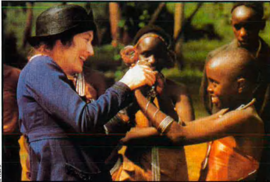
La pel·lícula Memòries d'Àfrica , protagonitzada per Robert Redford i Meryl Streep, va fer vessar moltes llàgrimes, però no va incidir en la problemàtica real del continent.

En aquesta dèria actual per recuperar el temps perdut, per ser interculturals a marxes forçades hem oblidat el més important: que no els hàviem preguntat res. Sembla que no tinguem cap dubte que vulguin ser com nosaltres