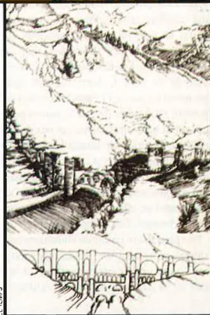
Dalt, vista aèria del santuari de Meritxell. A baix, esbós del Ponte Vecchio ideat per Ricard Bofill.

Monument nacional. La idea de construir un nou temple a Meritxell va néixer un any abans de l’incendi que la nit del 8 de setembre del 1972 va debastar el vell santuari. Les petites dimensions d’aquest el feien insuficient per albergar les grans concentracions de fervor envers la patrona de les valls andorranes, i el Consell General, propietari del lloc, va convocar un concurs d’idees per procedir a una ampliació de l’ermita —un edifici neoromànic del segle XVII— o a la construcció d’un temple de nova planta. Però després de produir-se el sinistre, als pròcers andorrans de l’època, en-