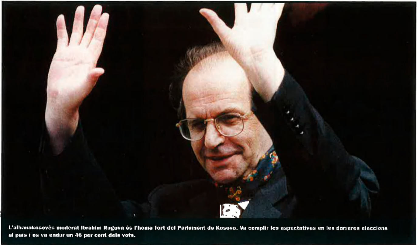
L'albanokosovès moderat Ibrahim Rugova és l'home fort del Parlament de Kosovo. Va complir les expectatives en les darreres eleccions al país i es va endur un 46 per cent dels vots.

senyals que enviava Belgrad a la comunitat sèrbia de Kosovo, més que confusos, demostraven el poc interès en l'assumpte. Haekkerup, el representant especial del secretari general de l'ONU, la màxima i vertadera autoritat en el Kosovo actual, va concloure que era imprescindible convèncer el Govern de Belgrad perquè fes seves les preocupacions dels serbis de Kosovo. Els arguments de pes no li devien faltar, atès que, actualment, el futur de la federació iugoslava penja d'un fil. Irònicament, és Javier Solana, un dels homes més odiats pels nacionalistes serbis (perquè va donar l'ordre d'atac aeri contra les forces sèrbies, el 1999), el que mitjança en les negociacions entre Sèrbia i Montenegro, sobre el manteniment o no d'un estat comú.