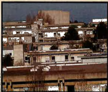
La UAB s'afegeix a la Insubmissió de la LOU de la UdG.