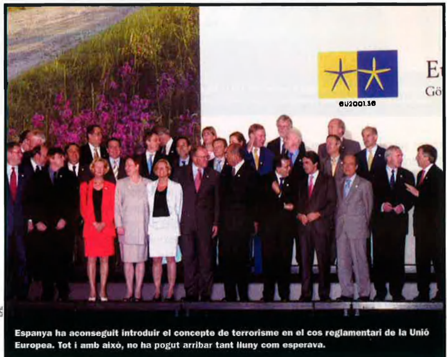
Espanya ha aconseguit introduir el concepte de terrorisme en el cos reglamentari de la Unió Europea. Tot i amb això, no ha pogut arribar tant lluny com esperava.

Però les circumstàncies noves generen reaccions diferents i, finalment, els mi-