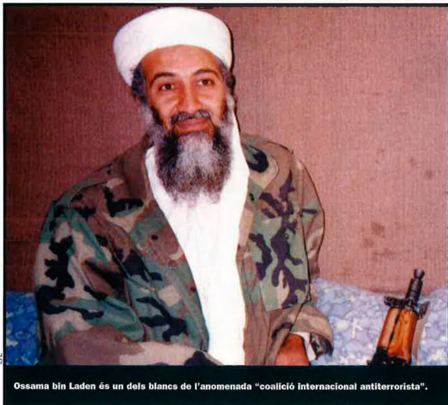
Ossama bin Laden és un dels blancs de l'anomenada "coalició internacional antiterrorista".

minació estrangera i reafirma la legitimitat de la seva lluita, en especial la lluita dels moviments d'alliberament nacional". Una resolució similar es va aprovar el 1987, només amb els vots negatius d'EUA i Israel.