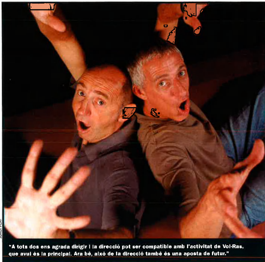
"A tots dos ens agrada dirigir i la direcció pot ser compatible amb l'activitat de Vol-Ras, que avui és la principal. Ara bé, això de la direcció també és una aposta de futur."

J. FANECA: I la plaça és molt gran, hi ha gent a l'arena però també n'hi