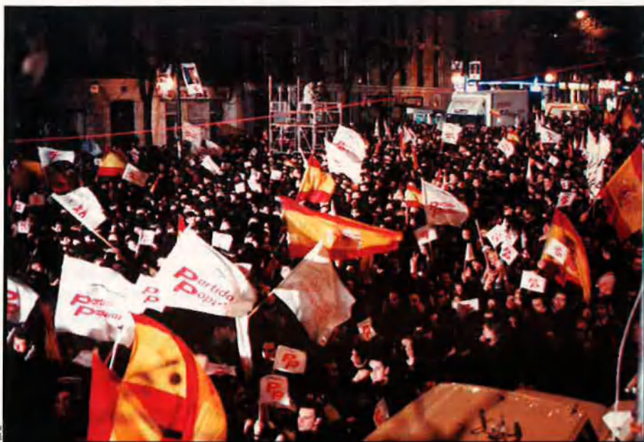
El 3 de març del 1996, el PP va guanyar les eleccions espanyoles. Quatre anys mes tard, va obtenir la majoria absoluta; s'iniciava així un procés de reactivació del nacionalisme espanyol.

Segons alguns teòrics, és un concepte més propi de les ideologies socialdemòcrates. Però, en tot cas, és una teoria que lliga més amb les vocacions universalistes dels nacionalismes d'estats, ja que en tenir el reconeixement d'un marc legal propi, no en necessiten cap altre, perquè el reconeixement dels ele-