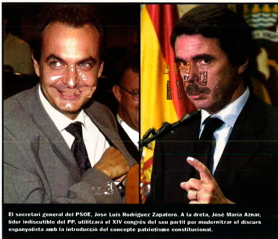
El secretari general del PSOE, José Luis Rodríguez Zapatero. A la dreta, José María Aznar, líder indiscutible del PP, utilitzarà el XIV congrés del seu partit per modernitzar el discurs espanyolista amb la introducció del concepte patriotisme constitucional.