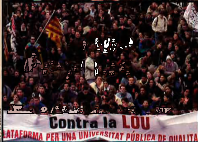
Dalt, imatge de les prostitutes africanes al grau de València, que han patit reiterades agressions. Les manifestacions racistes creixen al País Valencià mentre les autoritats miron cap a un altre lloc. Al costat d'aquestes ratlles, imatge d'una manifestació contra la LOU. Creixen les manifestacions universitàries contra aquesta llei.

Madrid que van morir el passat mes d'agost presumiblement per l'estat defectuós d'algun component del dialitzador d'aquesta empresa. Cadascuna de les famílies rebrà 55 milions per retirar totes les acusacions contra la corporació als jutjats. Els familiars de l'altre pacient que va morir, a Barcelona, no han arribat a cap acord de moment. Els representants de Baxter asseguren que encara no s'han posat en contacte amb ells. El Ministeri de Sanitat espanyol i l'associació de pacients renals Alcer sí que continuaran amb les accions judicials contra l'empresa.